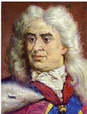
August II Mocny

2 Przyporządkuj opisy do przedstawionych postaci. Wpisz odpowiednią literę oznaczającą jej charakterystykę pod właściwym zdjęciem. Jeden opis jest niepotrzebny.