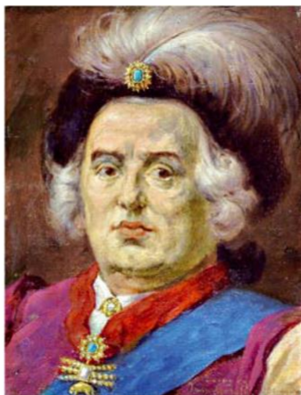
August III Sas